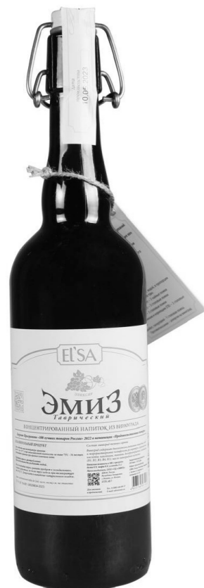
ЭМИЗ ТАВРИЧЕСКИЙ (150МЛ) 890 р