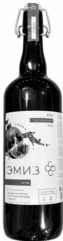
ЭМИЗ ГРАНАТОВЫЙ (150МЛ) 890 р