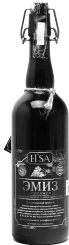
ЭМИЗ ПРЕМИУМ (150МЛ) 1290 р